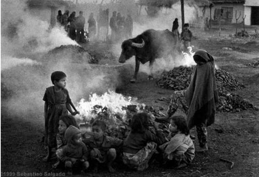
1999 Sebastiao Salgado "çocuk çocuk, ailece olumsuz koşulların getirdiği şartlara birlikte karşı koyma çabası" şd