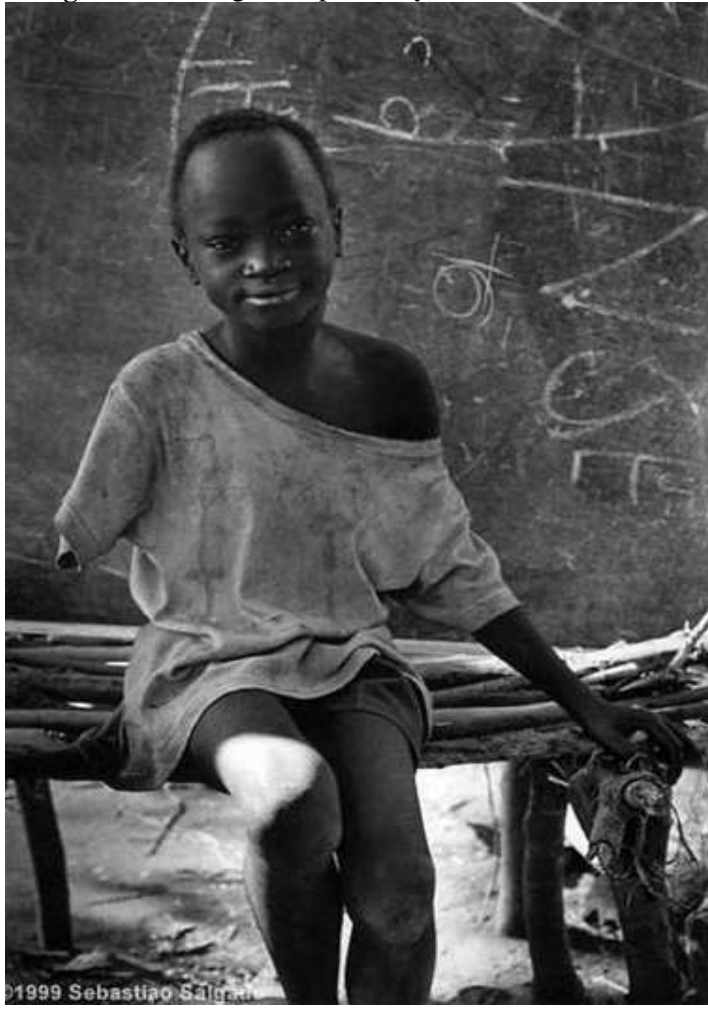
”yoksulluk, eksik bir kol, acı bir gülüş...” Şd