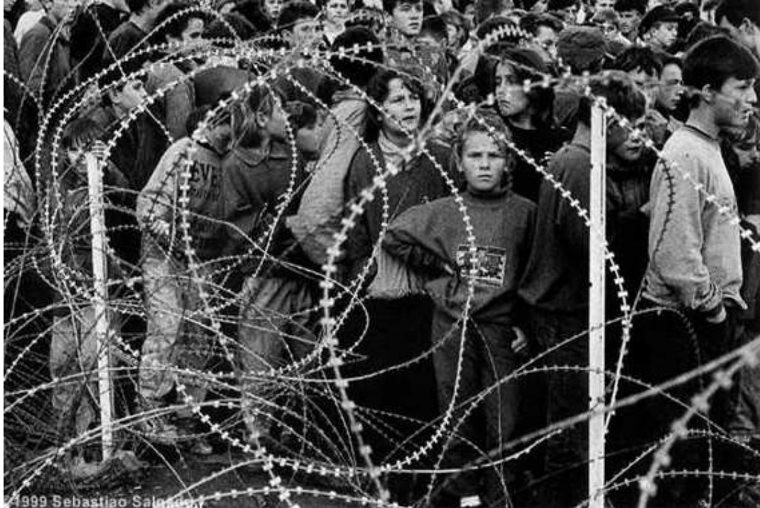
Fotoğraf 11 : Bihacı sığınmacılar, geride bıraktıkları sevdiklerinden mektup bekliyorlar; posta haftada bir Kızılaç tarafından dağıtılıyor. Batnoga-Krajina (Sırların kontrolündeki bölge).1994.

”özgürlükleri kısan en önemli simge dikenli tel. ne kadar da çok ve karmaşıklar. Özgürlüğü kısıtlananlarda öyle....” Şd