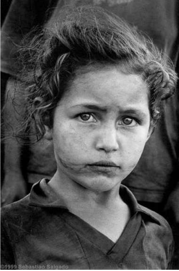
Fotoğraf 8 : Evsiz göçmenler, Rio Bonito Do Iguacu. Parana State, Brazilya. 1996.