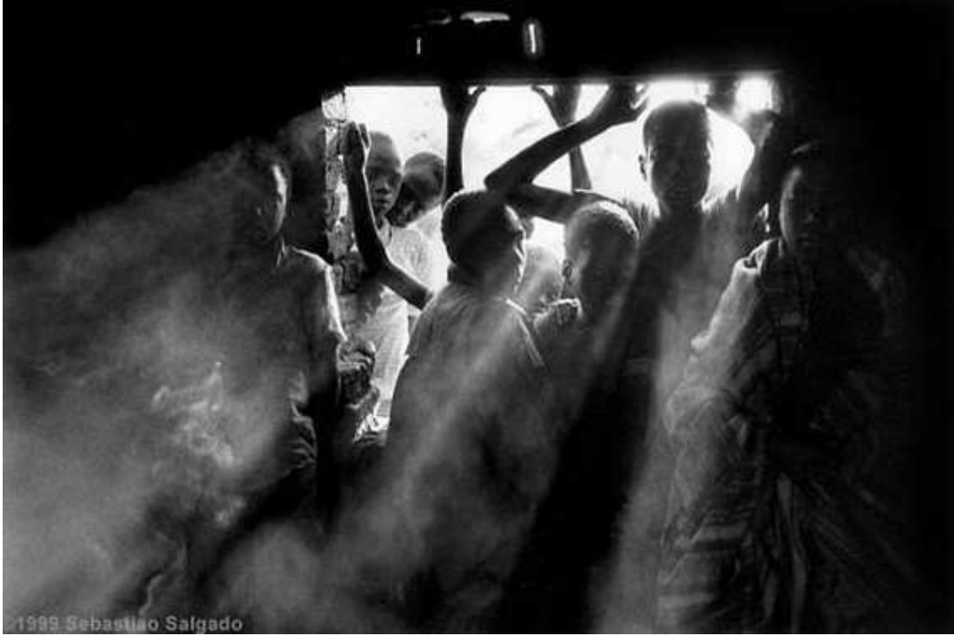
1999 Sebastiao Salgado "aşında hastalık ve ölümün kol gezdiği kampa, biran önce kurtulmak istenilen dış dünyadan bakış" şd