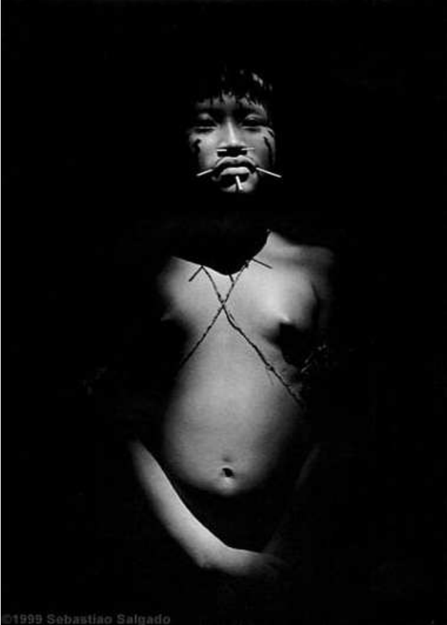
Fotoğraf 9 : Lafakabuco mezras, Surucucus.Yanomami genci, Roraima State. Brazilya. 1998.

”heran nereden nasıl geleceği belli olmayan belaların verdiği korku dolu gözler. Uzun süredir suya hasret saçların isyanı...” şd