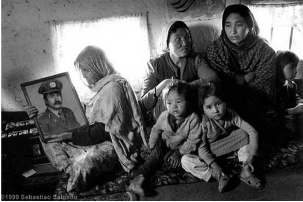
Fotoğraf 12 : Refugees from Kabul in the Shamak camp in Pul-i-Kumri. Afghanistan 1996.

“bir adam ve ailesi. Ama adam yok, sadece resmi kalmış. Küçük kız (soldaki) boşluğa mı, hayatının geleceğine mi dalmış acaba?” şd