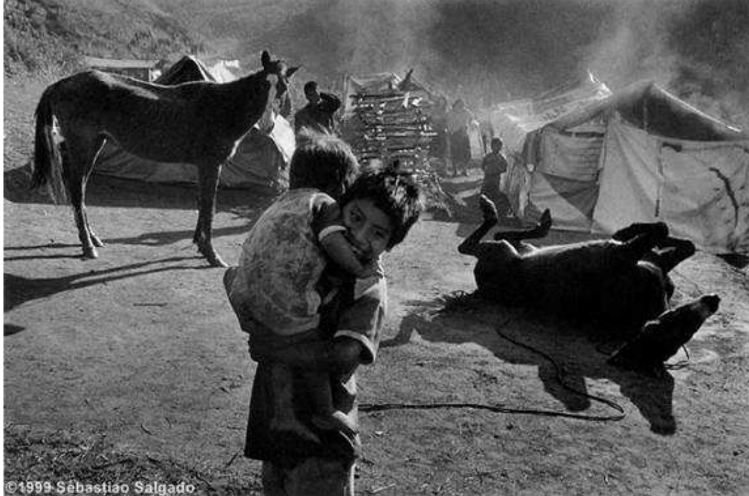
Fotoğraf 10 : Sürgüne gönderilmiş köylüler. Polho Chiapas, Meksika. 1998

” sürgünde olsa çocuk çocuktur ve oynamanın ne yeri ne zamanı vardır.” Şd