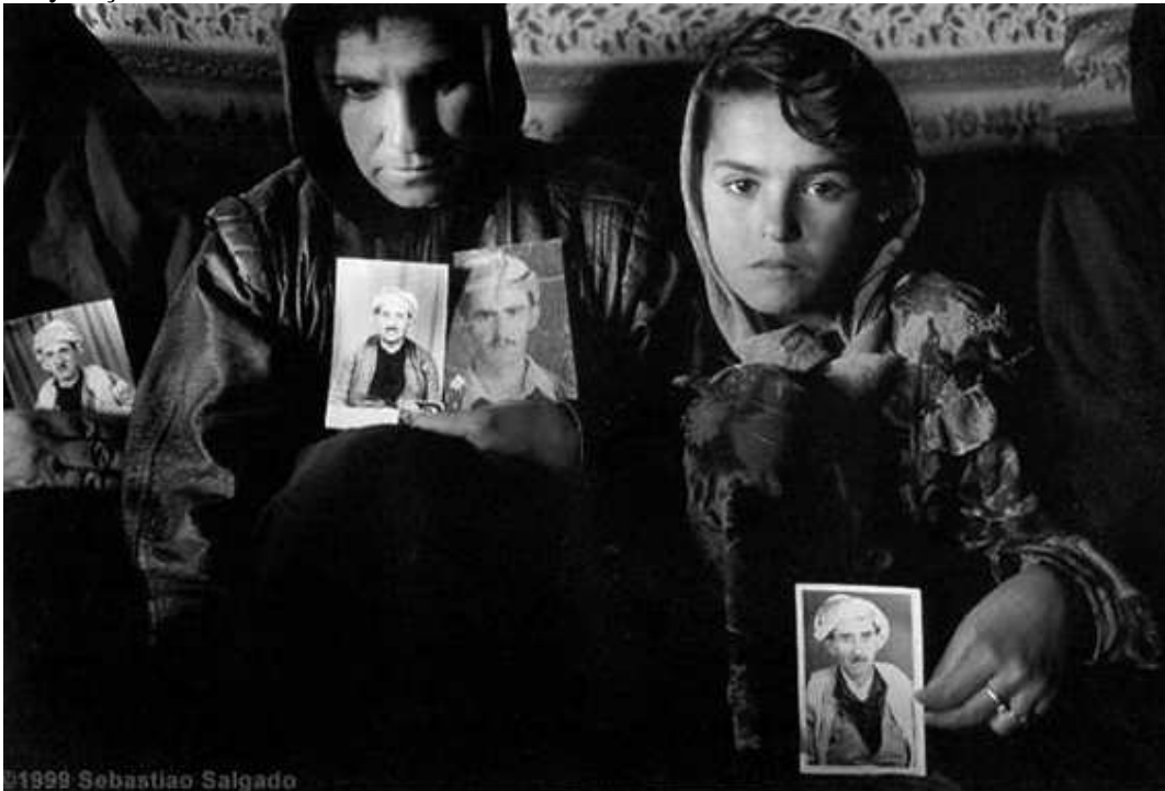
Fotoğraf 2 : 31 Temmuz 1983'de Iraklı askerler bir çok köylere girip yetişkin erkekleri topladılar. Onları bir daha hiç gören olmadı. Bugün dönmelerini ya da ölümlerini görmek isteyen çocuklar ve kadınlar hala beklemektedirler. Beharke, Irak. 1997.

”annenin yeni bakışlarına karşın genç kızın meydan okuyan, sorgulayan hüznü dolu delici bakışları” şd