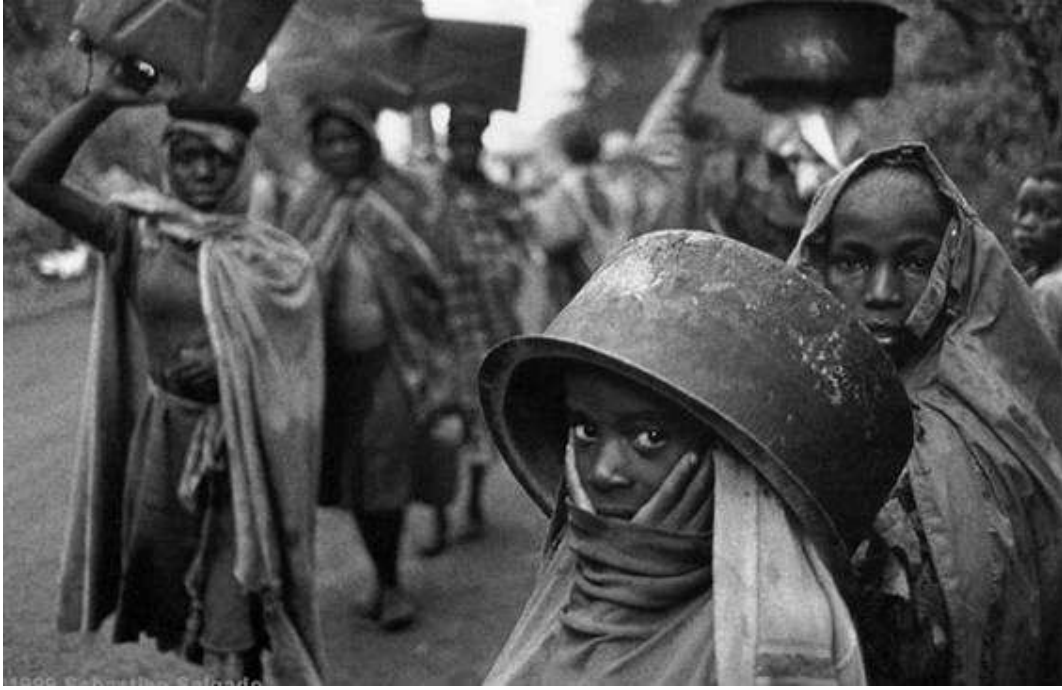
Fotoğraf 1 : Zaire'den kamyon ile gelen suyu almaya çalışanlar,1994.

”ön plandaki kadının gözlerinde taşıdığı acı, korku ve geleceği kavrayamamanın verdiği panik” şd