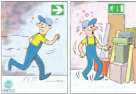
Şekil 6. Uygun olmayan acil çıkışlar

İşletmeler karşılaşılabilecekleri acil durumları (sel, yangın, deprem, vs.) belirlemeli, ekiplerini kurmalı, eğitimlerini vermeli ve acil durum sistemlerini (yangın söndürme tüpleri, yangın söndürme sistemleri, acil çıkışlar, vs.) kurmalı ve bakımlarını yapmalıdırlar. Şekil 6'da acil çıkış kapısının önüne konulan malzemelerden dolayı işlevini yapamaz hale geldiği görülmektedir.