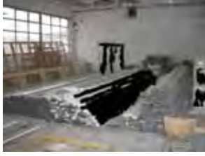
Şekil 1. Hatalı stoklanmış malzemeler.

önlemler arasında olabilir. Ayrıca ERP programları ve ERP programlarının etkin kullanılması da çözüm olabilir.