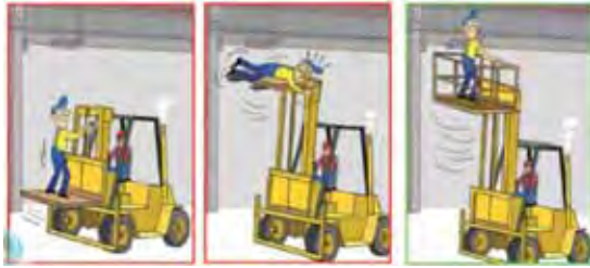
Şekil 4. Çalışanların hatalı davranış örnekleri.